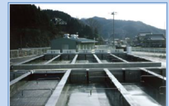
さけ・ます種苗生産施設