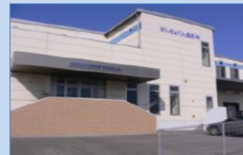
水産加工処理施設